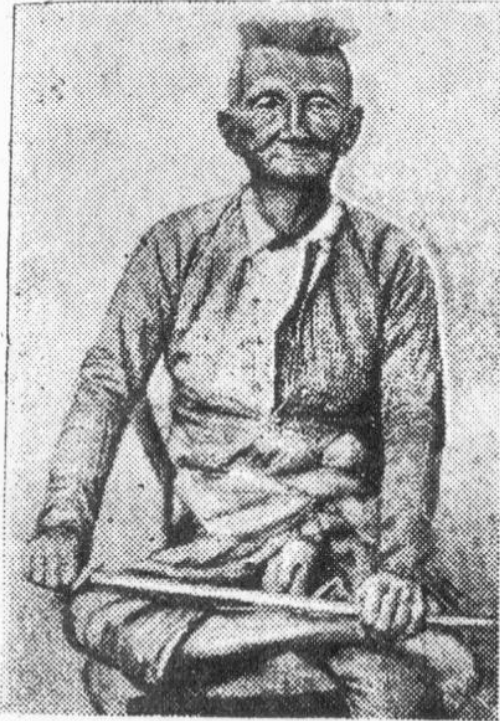
เจ้ากาวิโลรส แห่งเชียงใหม่ ถ่ายเมื่อ พ.ศ. ๒๔๓๒