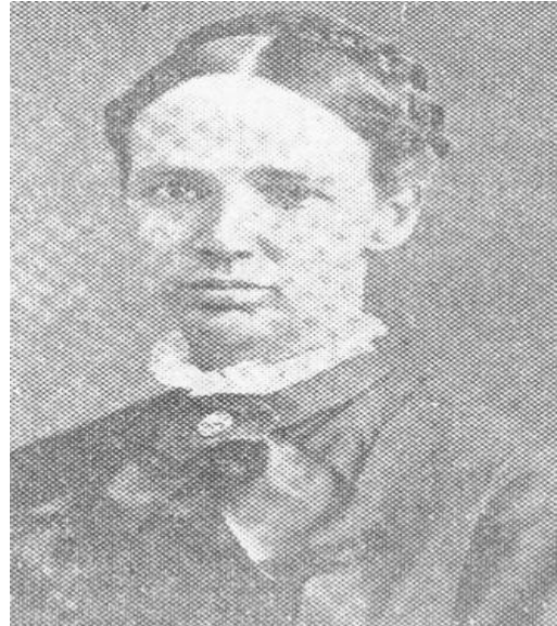
แฮมมแมคกิลวารี ถ่ายเมื่อ พ.ศ. 2424