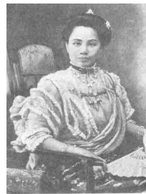
พระราชชายาเจ้าดารารัศมี

ดร.แคเนียล แมคกิลวารี และโซเฟียภรรยา พบว่ามีสตรีเพียง 2 คน เท่านั้นในนครเชียงใหม่ที่สามารถอ่านออกเขียนได้ นอกนั้นก็จะเป็น เด็กชายที่มีโอกาสบวชเรียนจากพระสงฆ์ตามวัดต่าง ๆ เพราะยังไม่มี โรงเรียนเอกชนเช่นปัจจุบันจากบันทึกอัตชีวประวัติ “กึ่งศตวรรษในหมู่ชน ชาติไทยและลาว” ดร.แคเนียล แมคกิลวารี จึงมีความเห็นว่า สิ่งแรกที่จะ ต้องจัดทำก็คือ การตั้งโรงเรียนสำหรับสอนสตรีคริสเตียนเพราะ ครอบครัวที่มาเข้ารับคริสต์ศาสนา มีจำนวนเด็กหญิงมากกว่าเด็กชาย มี นักเรียนหญิงประมาณ 6-8 คน ที่มาเป็นนักเรียนประจำกินนอนอยู่กับ